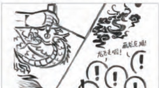
拾 画作莫不惟妙惟肖，跃然纸上，趣味盎然，特色写意。赠人佳礼，纪念佳品，收藏佳作。