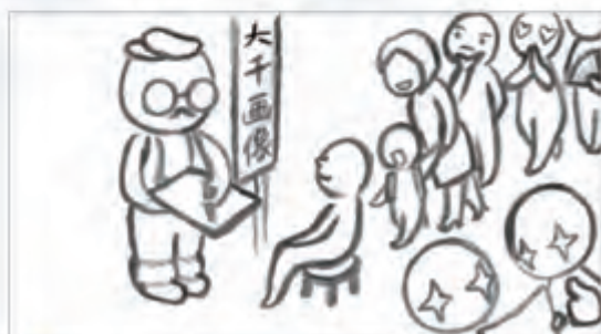
玖 等画者目不转睛，迫不及待；