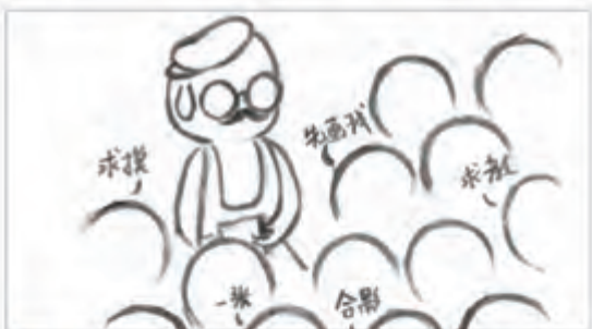
捌 所指之处，客至如云，纷至沓来。或驻足好奇，或消遣时间，或慕其画技，或欲求墨宝。