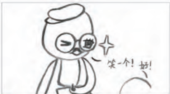
陆 画前，面对被画者，嘴部开合，出声示意最佳被画方位。画时，只见其或眨眼，或颌首，或侧目，憨态可掬。