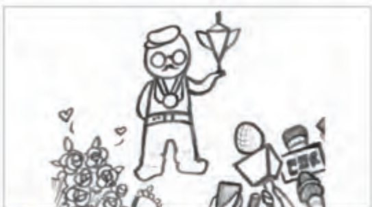
拾贰 观全程者赞不绝口，无不称奇。