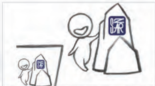
伍 客每立于身前，执笔一支，摹走龙蛇·勾眉描眼。少顷，画作出，笔简墨润·形神兼具·赠人可·收藏可。