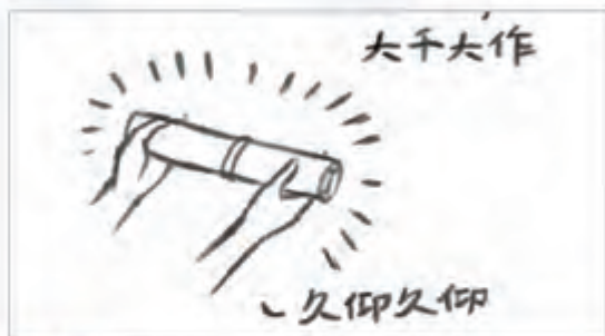
拾壹 得画者喜不自胜，爱不释手；