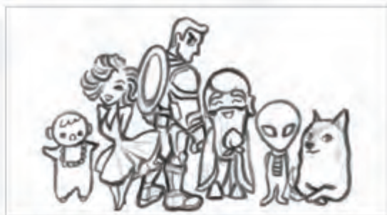
柒 被画者男女老少，高矮胖瘦，或坐或立，或掣或笑。时人或好奇，欲加工，因地制宜，皆允。